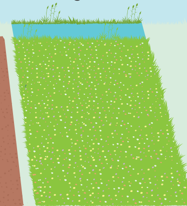
71 ha botanisch grasland