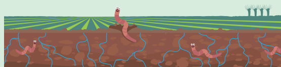
297 ha bodembeheer