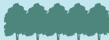
8 hout- en elzensingels