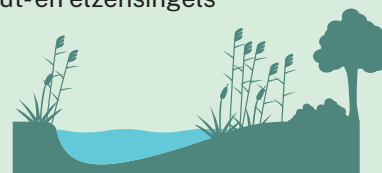
28 kilometer duurzaam slootbeheer en natuurvriendelijke oevers