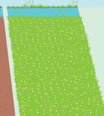
56 ha akkers en akkerranden