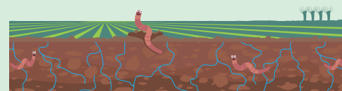
65 ha bodembeheer