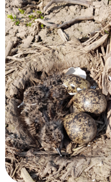
Kievitseieren komen uit.

In het Maurikse veld is in 2023 aan de oostkant een nieuwe plasdras aangelegd. Mooi om te zien dat deze gelijk bezocht werd door de weidevogels. De laatste jaren is hier een actieve vrijwilligersgroep opgestaan die de vogels goed in de gaten houdt. Agrariërs hebben aandacht voor de weidevogels. Afspraken om een plasdras langer te laten staan en het maaien uit te stellen zijn goed te maken.