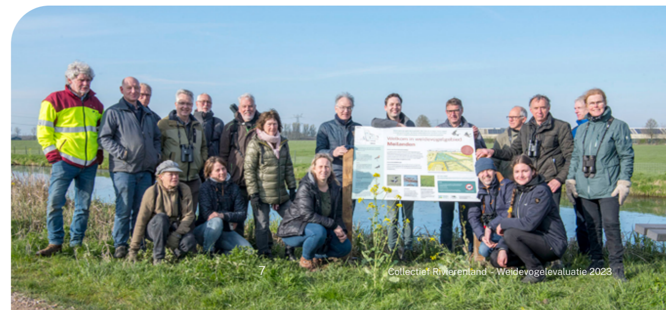
Onthulling weidevogelbord Meilanden

De weidevogelwerkgroep Overbetuwe verzorgt met zo'n 25 vrijwilligers hier het monitoren van de weidevogels. Naast de tellingen in het centrale gebied worden ook de gebieden eromheen gemonitord. De Randwijkse Waard is hier een voorbeeld van. Door de goede samenwerking tussen de vrijwilligers en de agrariërs is het vaak mogelijk het maaien uit te stellen zodat de vogels hun broedsel groot kunnen krijgen.