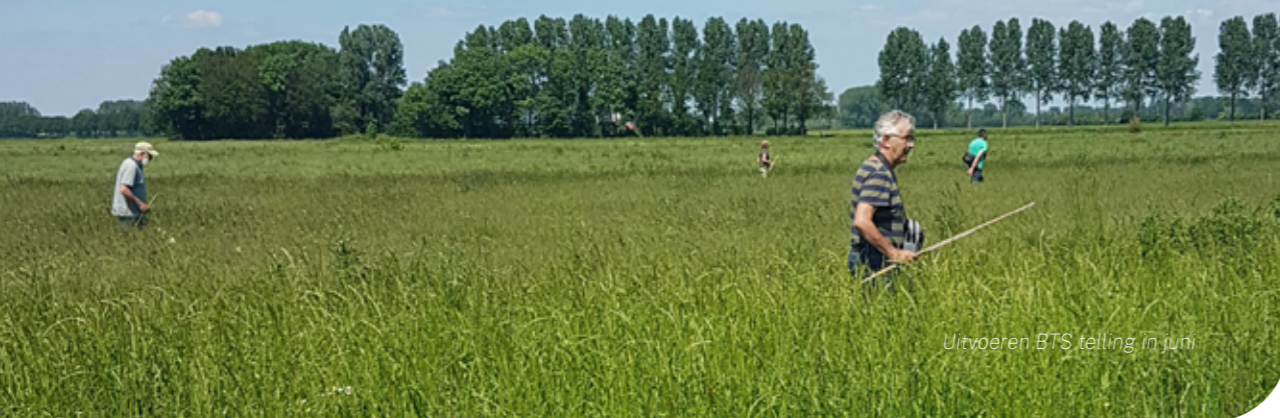
Uitvoeren BTS telling in juni