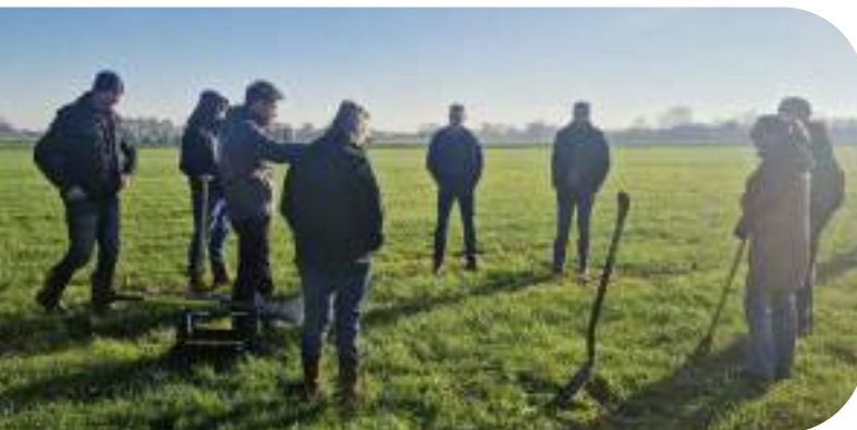
Samen de bodem bekijken

Het Magazine 50 TINTEN BOERENGROEN is dit jaar gepresenteerd. We vertellen het verhaal van 7 agrariërs die nu al hun bijdrage leveren aan de biodiversiteit en het landschap in het Rijk van Nijmegen. Vertrouwen, verbinden, samenwerken en doen! Het in beeld brengen van de kracht van het lokale netwerk in de Groene Mantel is gedaan in het kader van het project Lokaal Netwerk gefinancierd door het Platform Natuurinclusieve Landbouw Gelderland. We laten zien dat met een positieve instelling en effectieve samenwerkingen al zoveel moois gebeurt in het agrarische landschap.