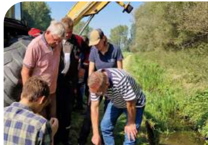
Demo ecologisch slootschonen

siteit en het landschap in het Rijk van Nijmegen. Vertrouwen, verbinden, samenwerken en doen! Het in beeld brengen van de kracht van het lokale netwerk in de Groene Mantel is gedaan in het kader van het project Lokaal Netwerk gefinancierd door het Platform Natuurinclusieve Landbouw Gelderland. We laten zien dat met een positieve instelling en effectieve samenwerkingen al zoveel moois gebeurt in het agrarische landschap.