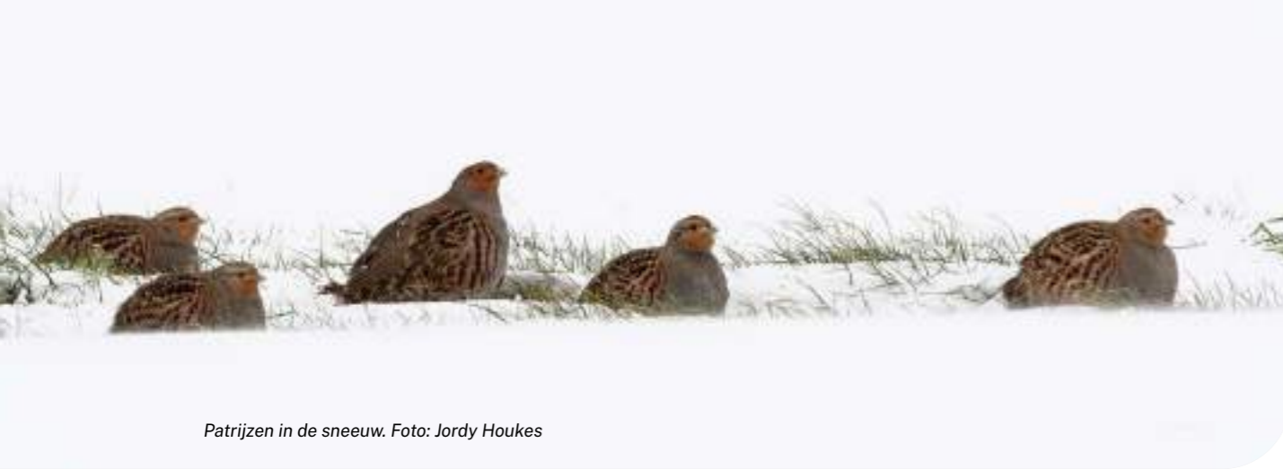
Patrijzen in de sneeuw.