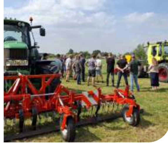
Demo doorzaaien kruidenrijk grasland

siteit en het landschap in het Rijk van Nijmegen. Vertrouwen, verbinden, samenwerken en doen! Het in beeld brengen van de kracht van het lokale netwerk in de Groene Mantel is gedaan in het kader van het project Lokaal Netwerk gefinancierd door het Platform Natuurinclusieve Landbouw Gelderland. We laten zien dat met een positieve instelling en effectieve samenwerkingen al zoveel moois gebeurt in het agrarische landschap.