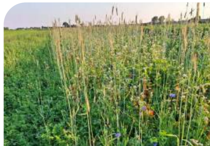
Luzerne/klaver en akkerkruidenstrook op de BAM-akker (Biodivers Akker Mozaïek)

patrijzen en overwinterende akkervogels worden door vogelakkers aangetrokken. Daarnaast vormen ze een goede voedselbron voor muizen etende roofvogels zoals (steen)uilen.