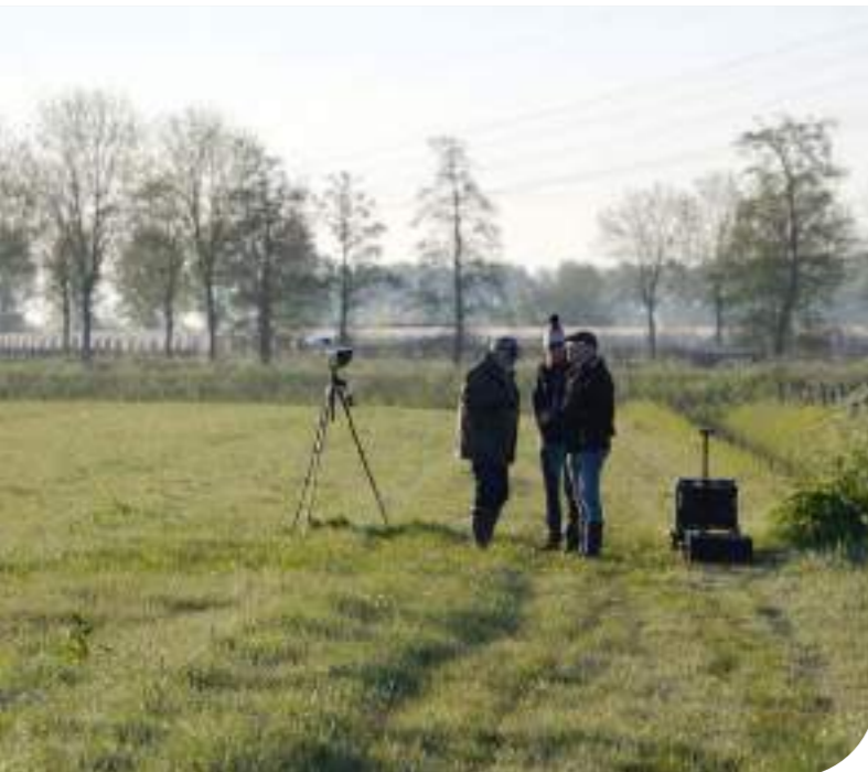
Vrijwilligers met drone.

Inmiddels is er in het hele riviereengebied 38 ha plasdras gerealiseerd. Ook werd er op vele plekken last-minute beheer in de vorm van kuikenland toegevoegd. Dit ondersteunt de kuikens door goede bescherming en voedselvoorziening te bieden. In