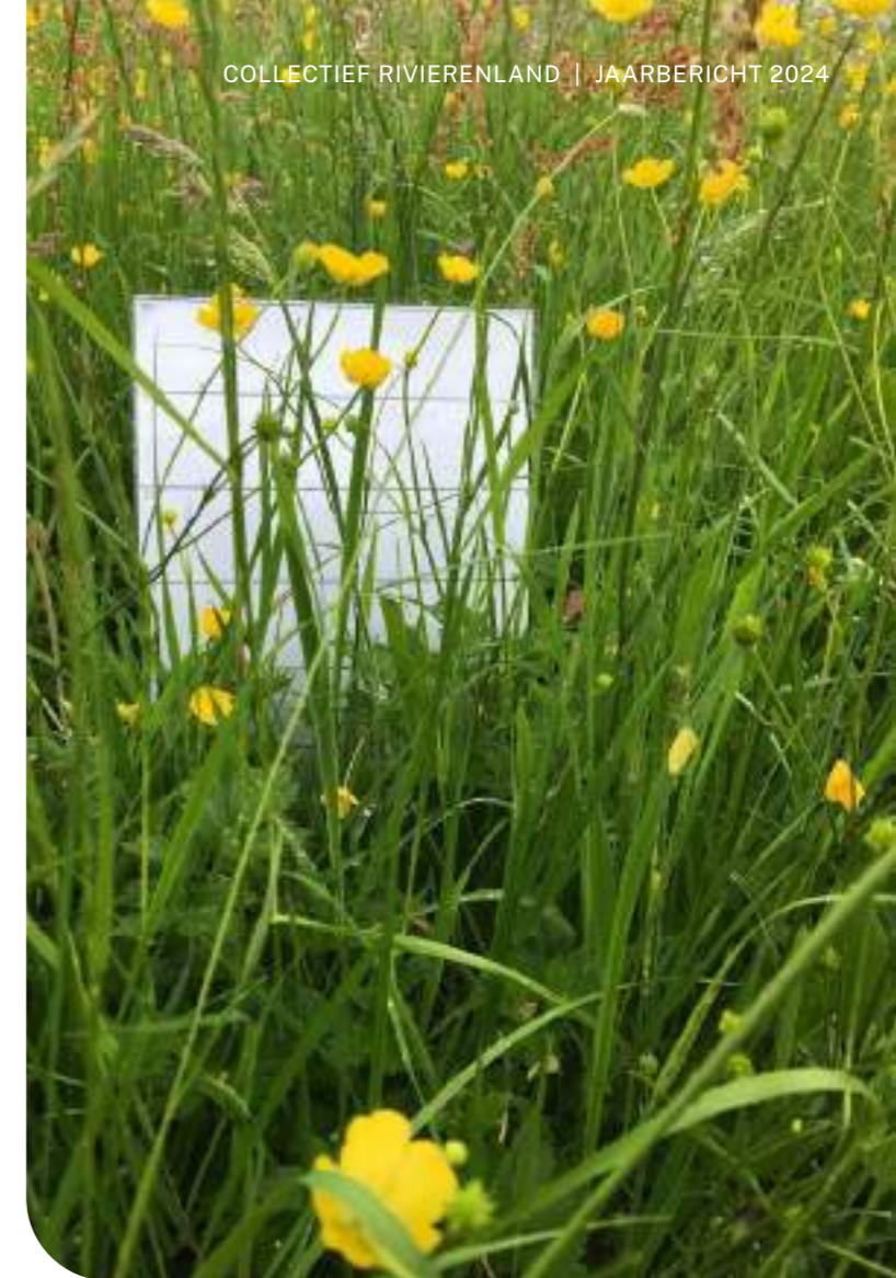
Grashoogte meten tijdens beheermonitoring

Naast beheer gericht op weidevogels en patrijzen is ook steeds maar nadruk op beheer voor amfibieën en vissen. Hierbij werden er dit jaar bij 21 deelne-